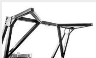
Механическая толкающая рама (по дополнительному заказу)