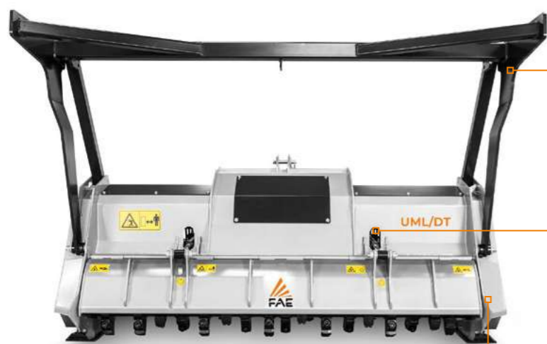
Механическая толкающая рама (по дополнительному заказу)