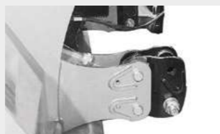
Регулируемое выдвижное трехточечное крепление